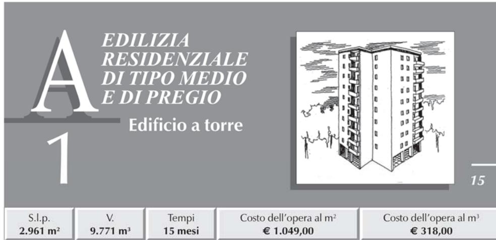
TABELLA RIASSUNTIVA DEI COSTI E PERCENTUALI D'INCIDENZA