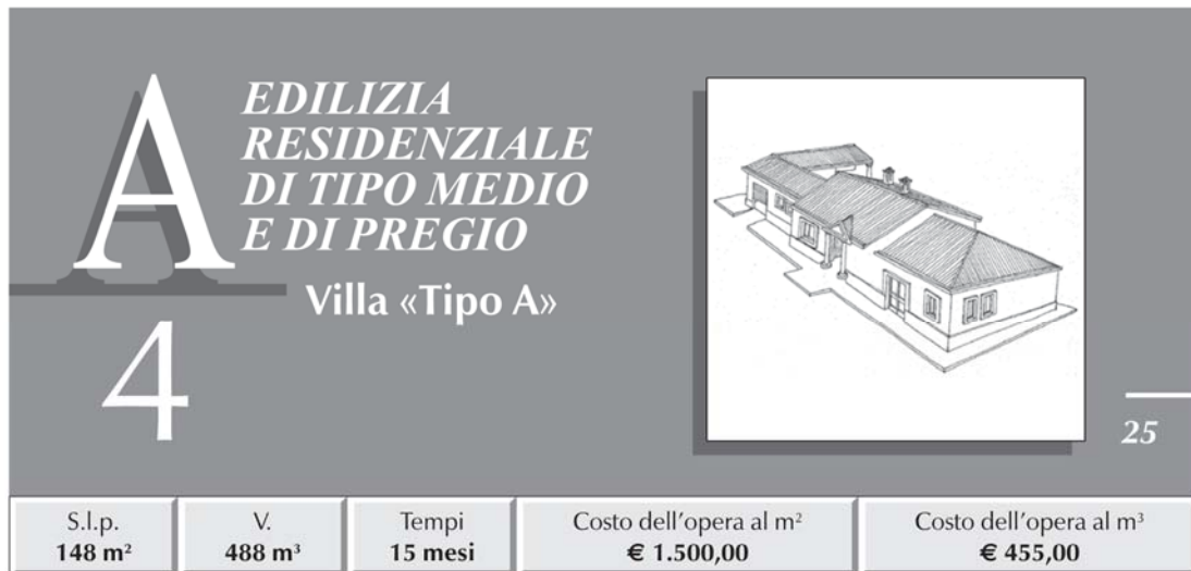
TABELLA RIASSUNTIVA DEI COSTI E PERCENTUALI D'INCIDENZA